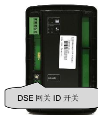
DSE 网关 ID 开关

注意: ID 必须设置为唯一的数字，它不同于连接到主控制器的其他 DSE2548 模块的 ID 数字。如果两个或更多的 DSE2157 扩展模块需要进行模拟测试，他们之间一定要配置不同的 ID。